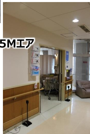
ツウカナール5Mエア