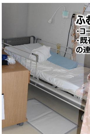
ふむナールLWエア ・コードレス ・既存のNsコールシステムとの連動可能

黒木記念病院では2022年11月に、令和4年度おおいた産医療関連機器導入推進事業補助金を利用し、トクソー技研株式会社製の離床センサーを導入しました。