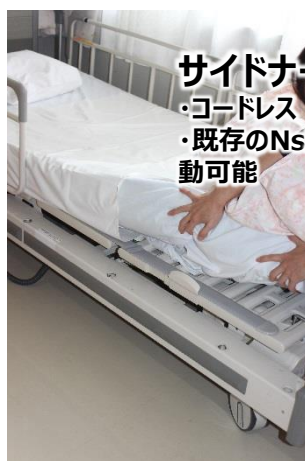
サイドナールWエア ・コードレス ・既存のNsコールシステムとの連動可能